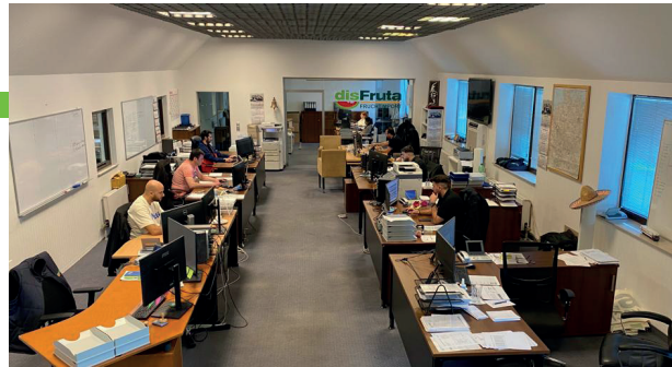
Avrupa çapında satış